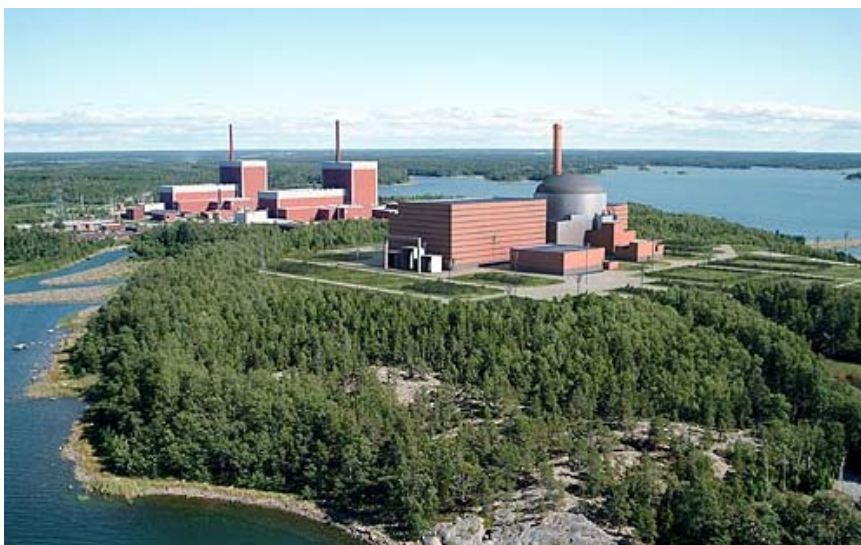
De EPR in aanbouw in Finland (artist impression).

De EPR is momenteel in aanbouw in Olkiluoto, Finland en staat gepland voor bouw in Flamanville, Frankrijk, te starten in 2007. EPR staat voor European Pressurized water Reactor, een drukwaterreactor. Dit is het enige derde-generatie reactorontwerp van Europese makelij; de fabrikant is Framatome ANP, bestaande uit de gefuseerde Franse reactorbouwer Framatome en Duitse evenknie Siemens. De EPR heeft het grootste eenheidsvermogen van de hier besproken reactoren: 1600 MWe. Het is een volledig evolutionair reactorontwerp, uitgaand van dezelfde veiligheidsfilosofie als de meest recente series Franse en Duitse reactoren. Een extra veiligheidssysteem is de zgn. “corecatcher” (kernvanger) onder het reactorvat, die in het geval van volledig smelten van de reactorkern zorgt dat de radioactieve smelt zich niet verder verspreidt.